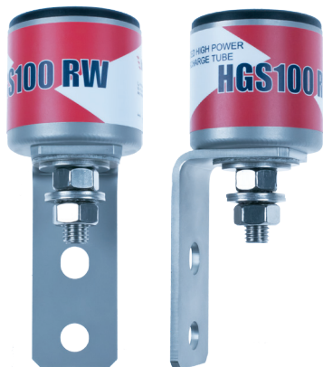
HGS100 RW 250V